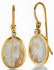
F2103 Rutilquarz Dia. 0,02ct H/SI € 385