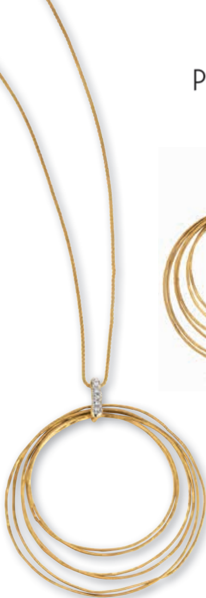
F2123 Brill. 0,025ct H/SI · 45cm € 769