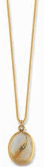
F2102 Rutilquarz Dia. 0,01ct H/SI · 45cm € 385