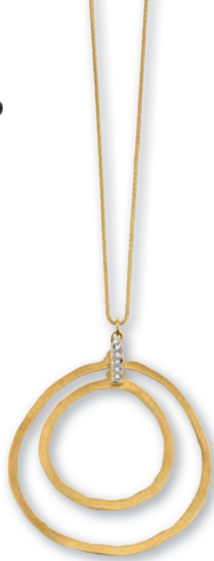
F2120 Brill. 0,025ct H/SI · 42cm € 769