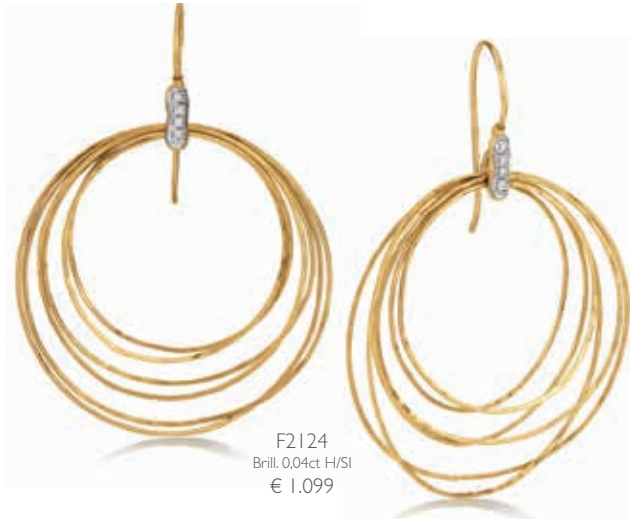
F2124 Brill. 0,04ct H/SI € 1.099