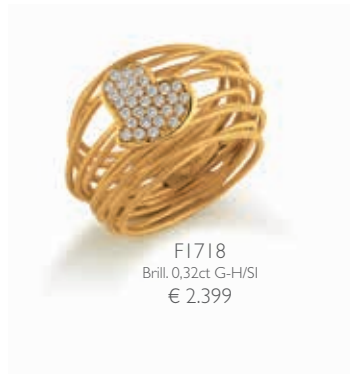
F1718 Brill. 0,32ct G-H/SI € 2.399