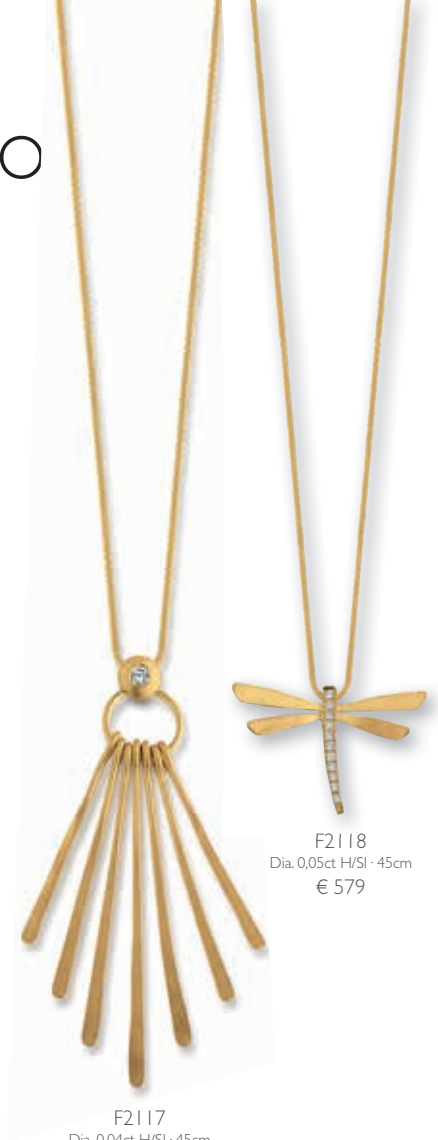
F2118 Dia. 0.05ct H/SI · 45cm € 579