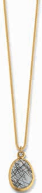
F2104 Rutilquarz schwarz Dia. 0,01ct H/SI · 45cm € 385