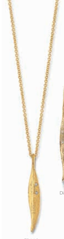
F2110 Dia. 0,01ct H/SI · 42cm € 455