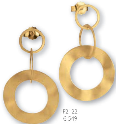
F2122 € 549