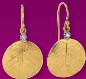
F2126 Brill. 0,04ct H/SI € 645