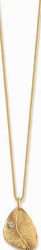
F2113 Dia. 0,01ct H/SI · 45cm € 399