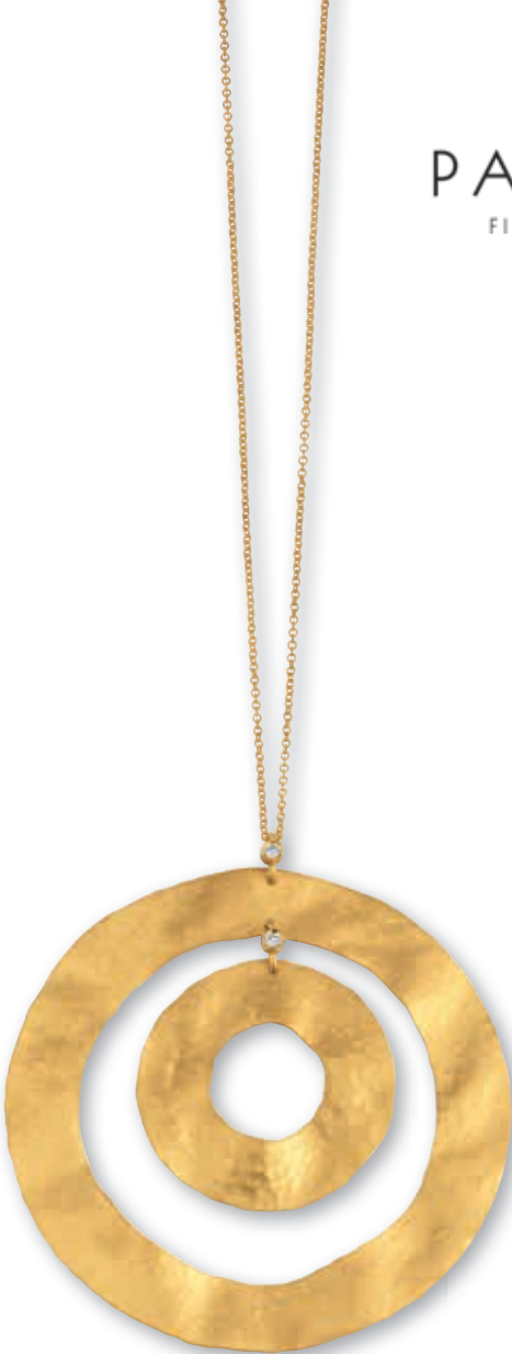
F2121 Brill. 0,04ct G-H/SI · 55cm € 1.099