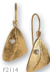
F2114 Dia. 0,02ct H/SI € 359