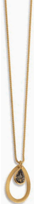
F2106 Rauchquarz · 45cm € 365