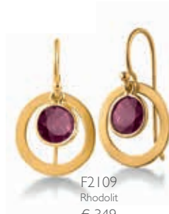
F2109 Rhodolit € 349