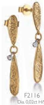
F2116 Dia. 0.02ct H/SI € 325