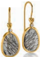
F2105 Rutilquarz schwarz Dia. 0,02ct H/SI € 385