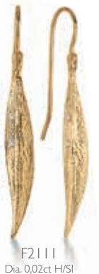
F2111 Dia. 0,02ct H/SI € 365