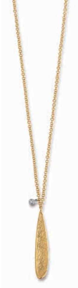
F2115 Dia. 0.01ct H/SI · 45cm € 335