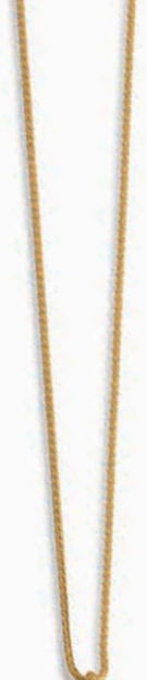
F2108 Rhodolit · 45cm € 365