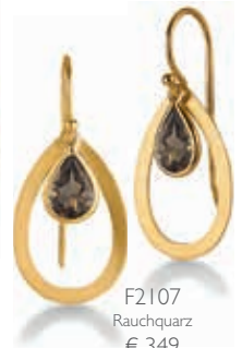
F2107 Rauchquarz € 349