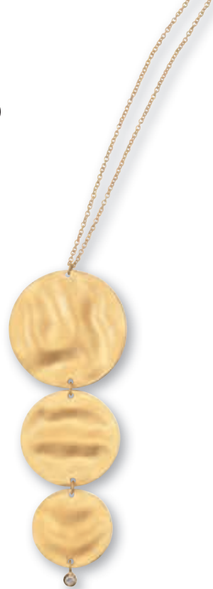
F1722 Brill. 0,02ct G-H/SI · 42cm € 699