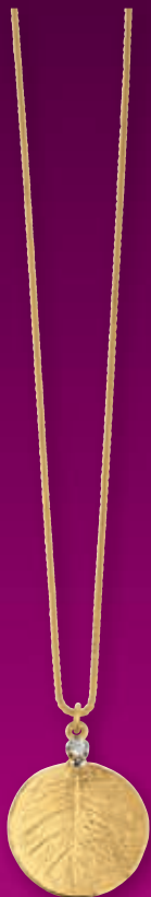
F2125 Brill. 0,02ct H/SI · 45cm € 499