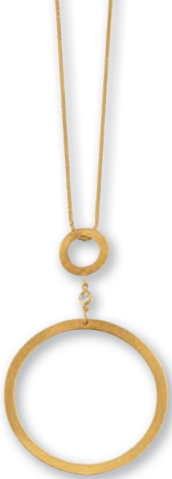
F2119 Brill. 0,02ct H/SI · 45cm € 599